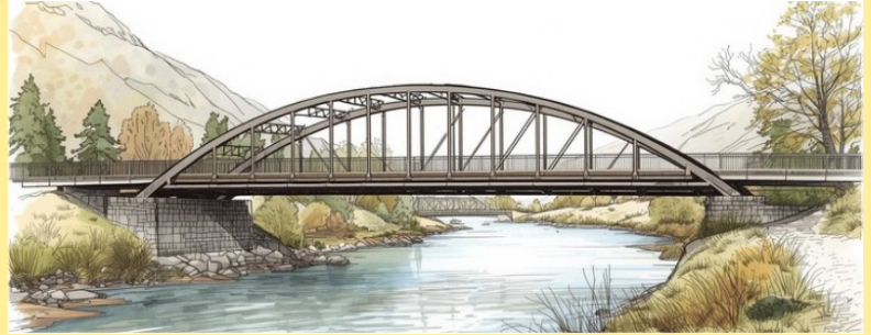
Symbolische Darstellung (keine reale Planung oder Abbildung)

Bereits zu Beginn des Projekts haben wir darauf gedrängt, mehrere Brückenvarianten prüfen zu lassen. Die von Verwaltung und Architekten favorisierte Lösung erschien uns frühzeitig als sehr kostspielig. Auch wenn ein direkter Vergleich mit anderen Brückenbauten in Nordhessen nur eingeschränkt möglich ist, da die Radwegebrücke über die Fulda als Bundesgewässer führt, fehlten aus unserer Sicht mindestens zwei weitere architektonische Alternativen, um sowohl gestalterisch als auch wirtschaftlich vergleichen zu können. Dieser Wunsch wurde vom Bürgermeister stets zurückgewiesen, da aus seiner Sicht keine Alternative zur vorgeschlagenen Variante bestand. Die fehlende Variantenprüfung hat dazu beigetragen, dass die Kosten heute deutlich über den ursprünglichen Annahmen liegen und weitere Steigerungen bis zur Fertigstellung zu erwarten sind. Aktuell ist das Verfahren pausiert, da aufgrund der gestiegenen Kosten der Förderantrag beim Land neu gestellt werden muss. Ob und in welchem Umfang die Mehrkosten gefördert werden, ist derzeit offen.